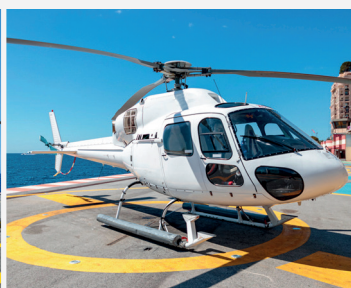
AS 355 N - Twin-engine 4/5 personnes