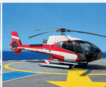
H130 - Single-engine 6 personnes