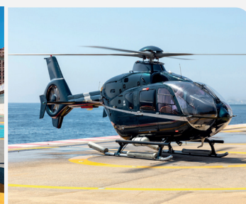
EC 135 T+ Twin-engine 5/6 personnes