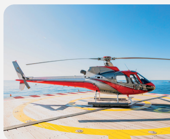
H125 - Single-engine 5 personnes